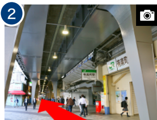
2 そのまま高架下を直進します。 (約 1分)