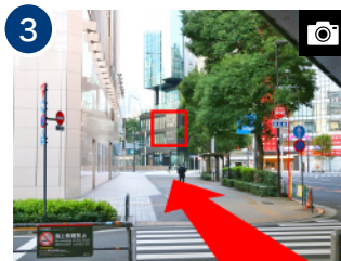
3 高架を抜けると正面にホテルが見えてきます。