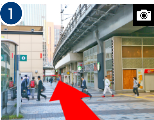
1 出口から正面へ直進します。