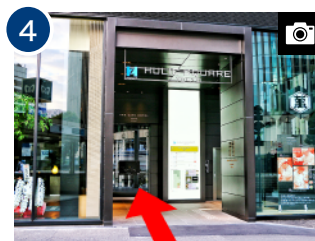
4 横断歩道を渡り、エレベーターで4階ロビーへお上がりください。