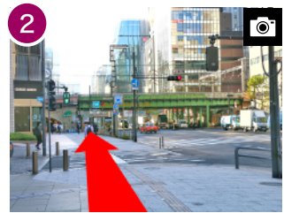
2 そのまま直進し、線路下をくぐります。(約 1 分)