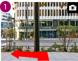
1 エレベーターを出て左折します。