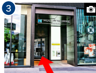
3 エレベーターで 4 階ロビーへお上がりください。