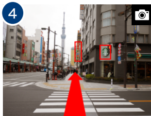
「スターバックス」を過ぎて 「くすりばばす」の奥隣りがホテル です。