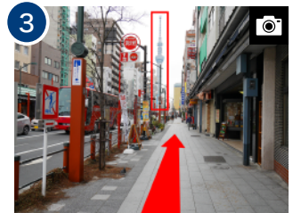
正面にスカイツリーを見ながら 直進します。(約3分)