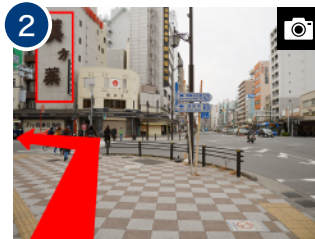
「漢方薬」の看板に向かって 横断歩道を渡り、左折します。