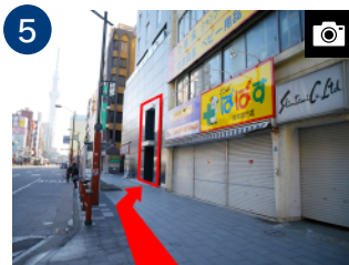
エレベーターで13階ロビーへ お上がりください。