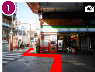
1 エレベーターを降りると正面に「Family Mart」があります。