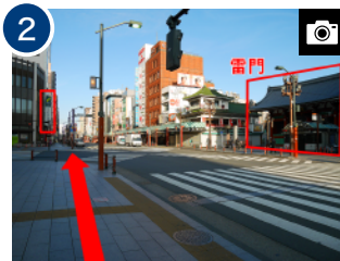
2 「雷門」を右手に見ながら、「三井住友銀行」へ向かって横断歩道を渡り、そのまま直進します。(約1分)