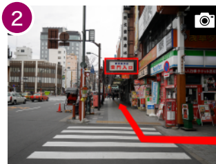
2 左奥「雷門入口」を40m程進むと雷門です。