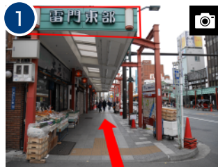
1 出口を出て、正面「雷門東部」のアーケード下を直進します。(約1分)