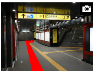
改札口を出て直進し、突き当りを右折します。エレベーターは突き当り右手にあります。