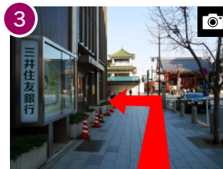
突き当りの「三井住友銀行」を左折し、直進します。(約 1分)