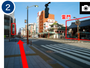
「雷門」を右手に見ながら、「三井住友銀行」へ向かって横断歩道を渡り、そのまま直進します。(約 1分)