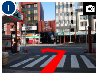
突き当りを左折、「雷門東部」のアーケード下を直進します。(約 1分)