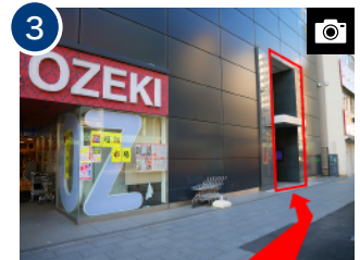
角に「OZEKI」(スーパー)のある建物がホテルです。エレベーターで13階ロビーへお上がりください。