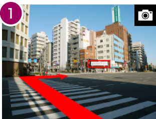
エレベーターを降りたら、正面の横断歩道を渡り、更に「喜多方ラーメン」に向かって横断歩道を渡ります。