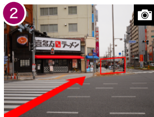
そのまま直進(約 2分)すると、正面に「雷門」が見えてきます。